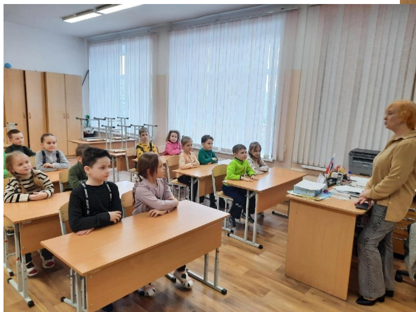
Экскурсия группы Берёзка в школу №150