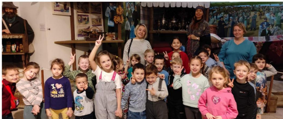
Группа «Кувшинка» Краеведческий музей Экспозиция «В гостях у Марьюшки»